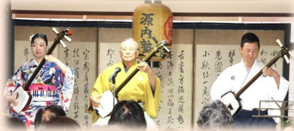
大谷菊愛 大谷菊一 大谷菊一郎

入場料：500円 ～売り切れ御免～ チケットは11/5（火）から岩船地域コミュニティセンターで取り扱っております。 【先着60名 全席自由】