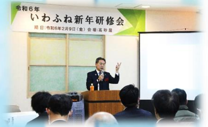
忠 副市長の講演の様子 令和6年2月9日（金）

洋上風力発電事業については、事業者が選定されたことにより、令和11年6月運転開始に向けて事業が進んでいく中、地元産業、港湾地域の活性化や、観光振興と地域貢献への期待など、これからの岩船地域の発展に繋げることができるかが重要であると感じました。