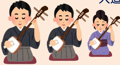
大谷 菊一 大谷 菊一郎 大谷 菊愛

入場料：500円 チケットは11/6（月）から岩船地域コミュニティセンターで取り扱っております。 【先着60名 全席自由】