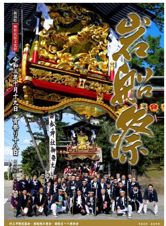
村上町観光協会・岩船商工業会・岩船まつり保存会