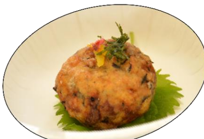
酒道楽 TEMPLE 酒鮭情け in 岩船