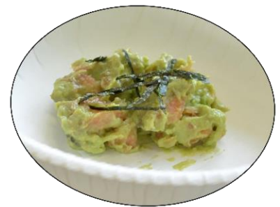
とさん小娘 鮭とアボカドのわさびマヨ