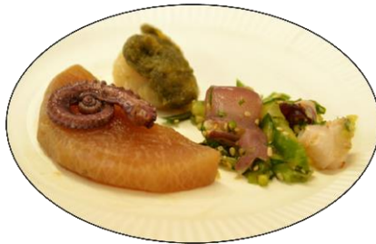
狂える料理人 ユウキ 帰ってきた！！たこ八郎