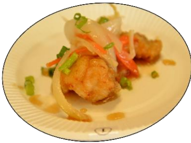
食堂 iwafune フグのマリネ風味