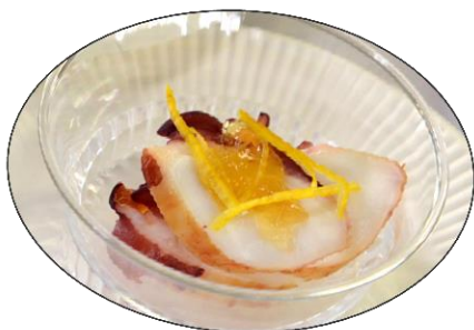
石井 順治 UTOO