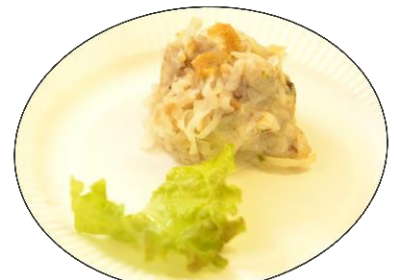
大滝食堂 野菜たっぷり！岩船DE焼売